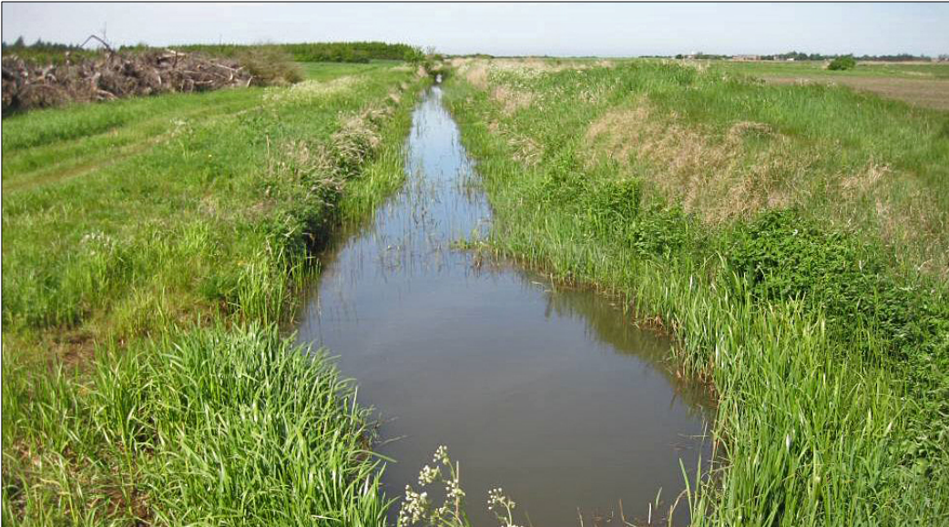
Kimmelkær Landkanal.

Natura 2000-området ligger i Ringkøbing-Skjern Kommune og indenfor Vanddistrikt Jylland og Fyn.