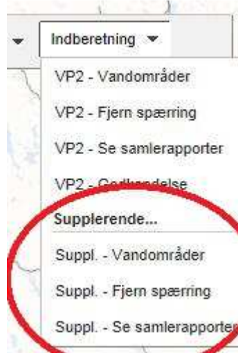
Figur 1. Vælg supplerende indsats

Indmelding af forslag til supplerende indsats forgår på samme måde som indmelding af forslag til indsatsprogram, men tilgås via to nye menupunkter i WebGIS-værktøjet.