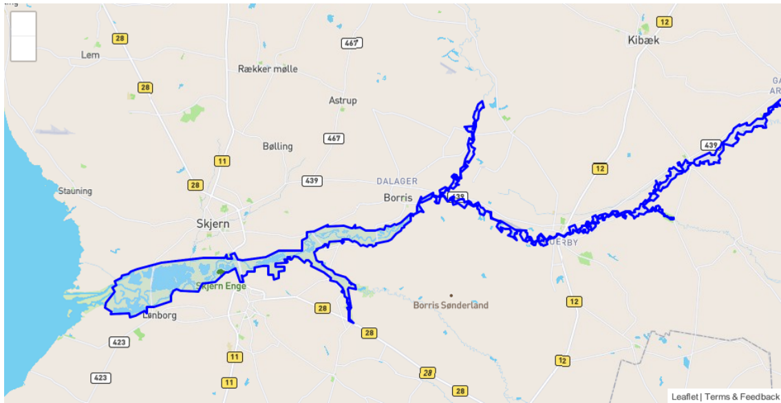
Tabel A: Kortlagte naturtyper på Naturstyrelsens arealer i Natura 2000-området