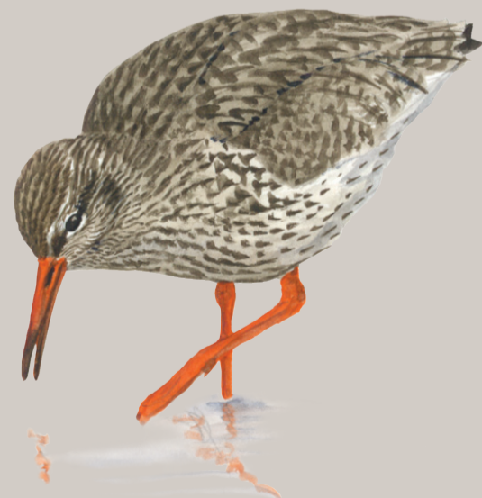
Rødben. Illustration: Jens Overgaard Christensen

Reservaterne får fuglene til at opholde sig her i længere tid på deres vej syd eller nordpå. Jægere og andre naturinteresserede kan dermed glæde sig over bedre muligheder for gode naturoplevelser.