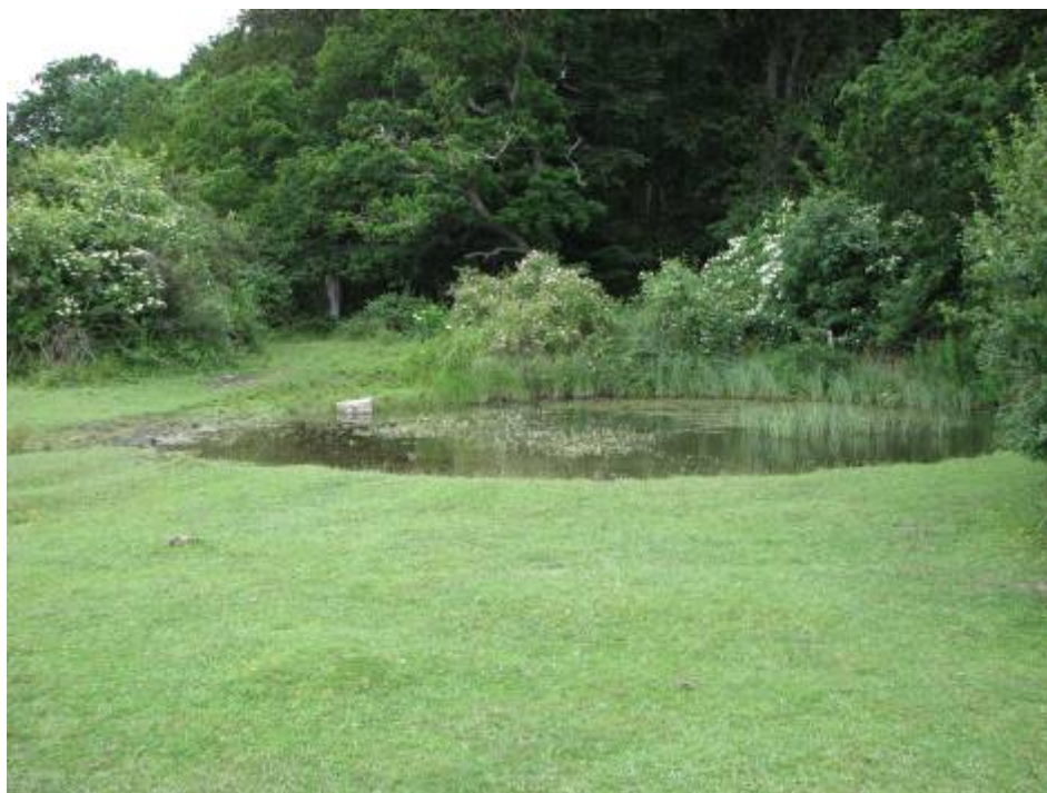
Næringsrig sø med flydeplanter i kanten af skoven. Søen er ynglested for springfrø, men prognosen for søen er ukendt. Springfrø udgør ikke en del af udpegningsgrundlaget.