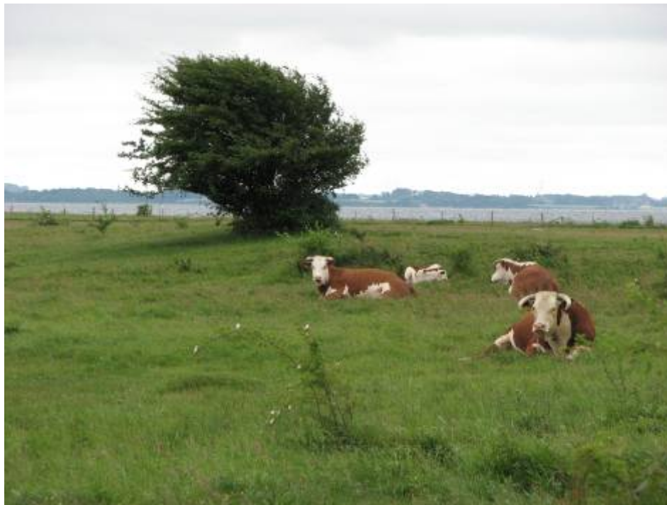
Thurø Rev bliver græsset af bl.a. kreaturer. Strandengene har en gunstig prognose, men der er mindre tilgroningsproblemer på kalkoverdrevet.