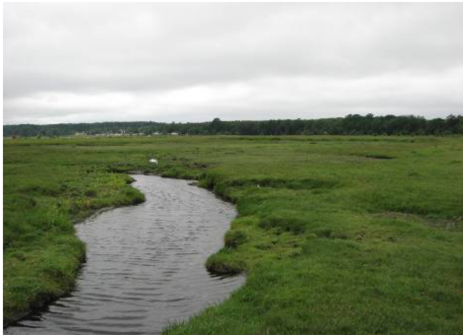
Thurø Rev indeholder en stor og meget veludviklet strandeng med forekomst af losystemer, tuer af gul engmyre og store sten i jordoverfladen. Strandengen skal sikres en fortsat hensigtsmæssig drift og pleje.

Indsatsprogrammet for Natura 2000-området omfatter nedenstående generelle og konkrete retningslinjer, som tillige er vist oversigtligt i bilag 2.