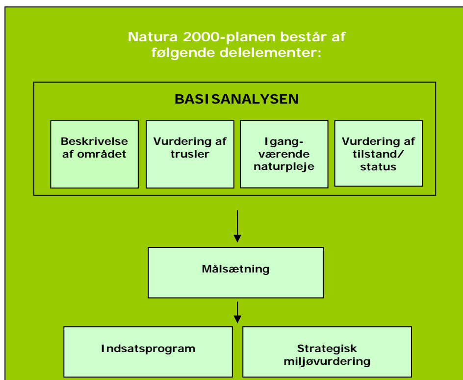
Figur 1. Opbygning af en Natura 2000-plan.

Planen omfatter "udpegningsgrundlaget", dvs. de naturtyper og arter, som området er udpeget for. Natura 2000-planens indhold er vist i figur 1.