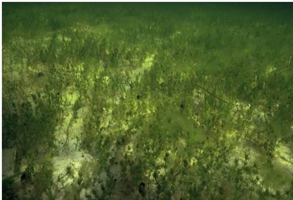
Kransnålalger vokser naturligt på sandbund flere steder i Det Sydfynske Øhav.