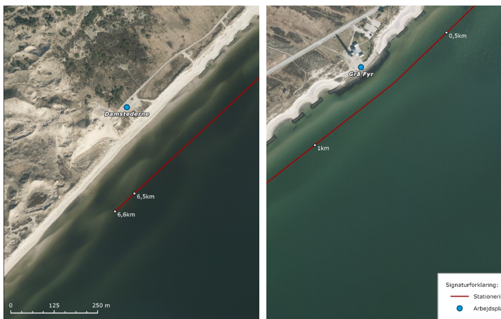
Figur 2 – Beliggenhed af arbejdspladser.

En arbejdsplads vil typisk rumme mandskabsvogn, kontorfacilitet, redskabscontainer, brændstoftanke, affaldscontainer og depot til udstyr. Desuden skal arbejdspladsen rumme parkeringsmulighed for de ansatte. Typisk vil et areal på ca. 500-1.000 m 2 være tilstrækkelig. Ved afsluttet arbejde vil entreprenøren reetablere området, så det efterfølgende så vidt muligt vil fremstå i sin oprindelige tilstand.