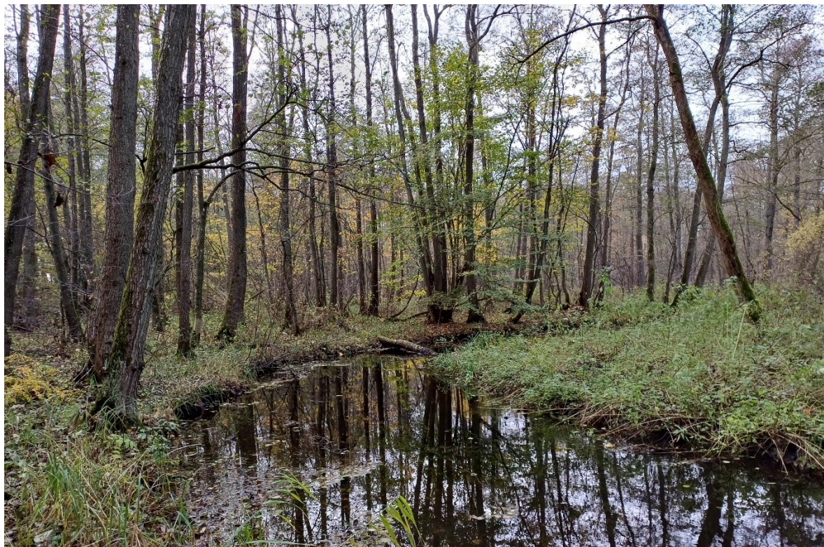
Skovnaturtypen elle- og askesump findes stedvis rundt i skovene og er udbredt langs Brændegård Sø, Nørresø og Silkeå som på billedet ovenfor.

*** Skovnaturtypebevarende drift og pleje dækker over flere indsatser, heriblandt sikring af naturtyper, træer til naturligt henfald, naturnær skovdrift, rydning af uønsket opvækst, problemarter og invasive arter samt skovgræsning og foryngelse.