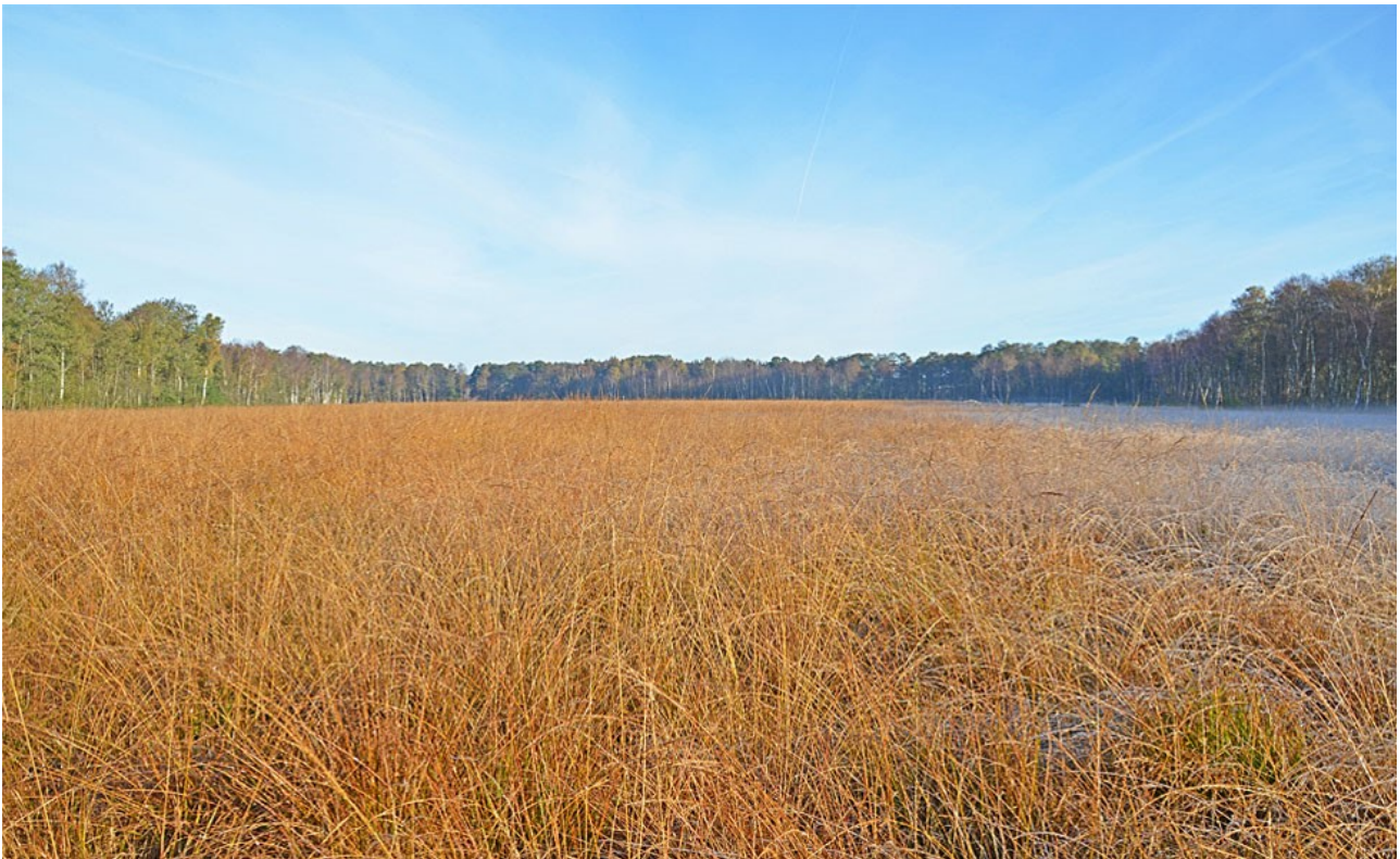
Højmosen Nybo Mose er under tilgroning med blåtop grundet uhensigtsmæssig hydrologi.

Indsatserne har dog kun omfattet mindre dele af de arealer der tidligere har været drænet. Der er derfor et fortsat behov for at genskabe mere optimal hydrologi i området.