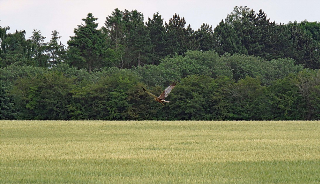
Rørhøgen, som her ses fouragere over en kornmark, er den del af Natura 2000-områdets udpegningsgrundlag.

Natura 2000-området Gammel Havdrup Mose ligger ca. 13 km sydøst for Roskilde. Der er udsigt over området fra landevejen mellem Roskilde og Køge, og store dele af området er tilgængelige for offentligheden.