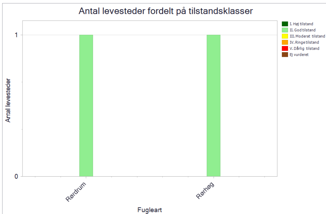
Antal og tilstand af de kortlagte levesteder for ynglefugle.

De enkelte levesteders tilstand kan ses på Miljøstyrelsens digitale kort i MiljøGIS .