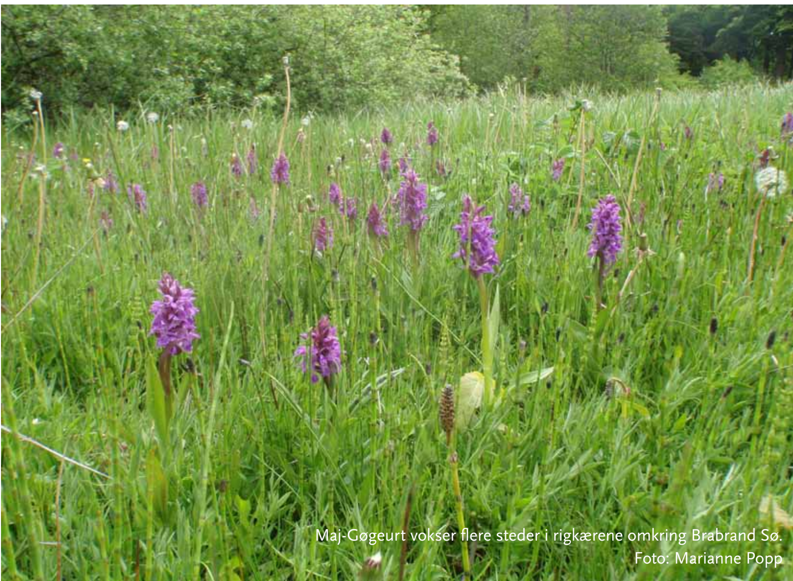
Maj-Gøgeurt vokser flere steder i rigkærene omkring Brabrand Sø.

Når afgræsning foregår uden eller med begrænset tilskuds fodring eller ved høslet (med fjernelse af den afslåede biomasse) vil effekten være særlig positiv, idet plejen i disse tilfælde både sikrer lysåbne forhold og fjerner næringsstoffer fra arealerne.