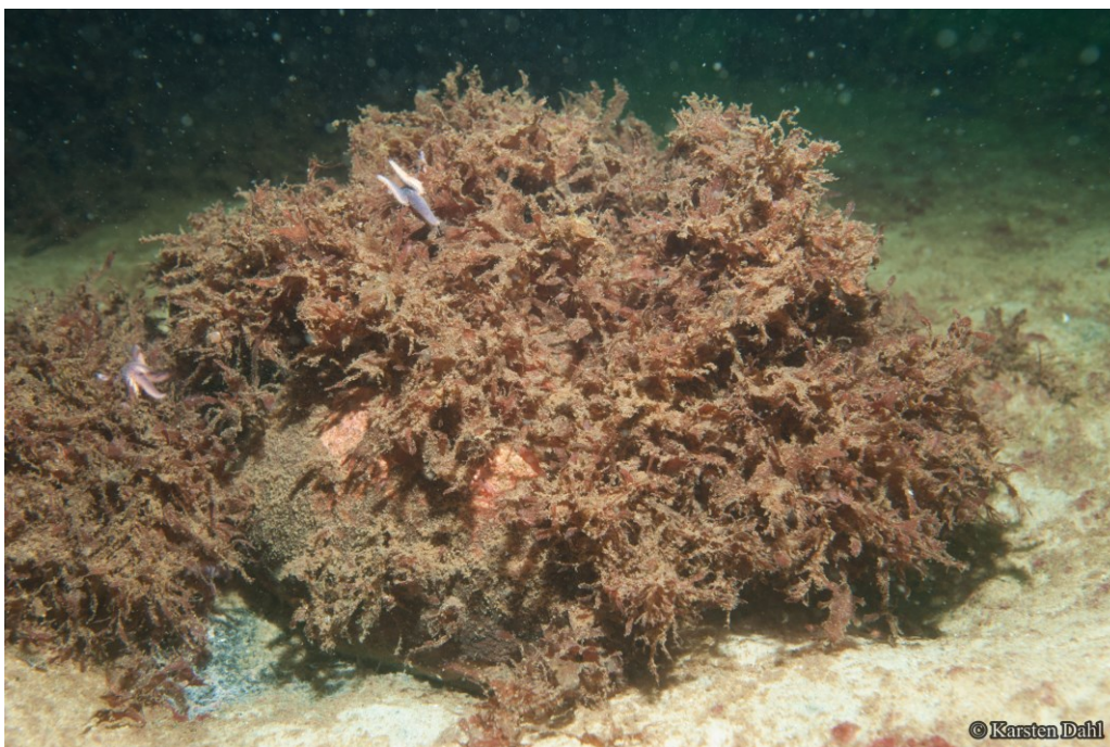
Sten på sandbund.

Dette Natura 2000-område er specielt udpeget for naturtypen rev og arten marsvin. Fuglebeskyttelsesområdet er udpeget for trækfuglene edderfugl og hvinand. Natura 2000-planens målsætning og indsatsprogram er væsentlige elementer i beskyttelsen af denne og af en generel sikring og forbedring af områdets naturværdier.