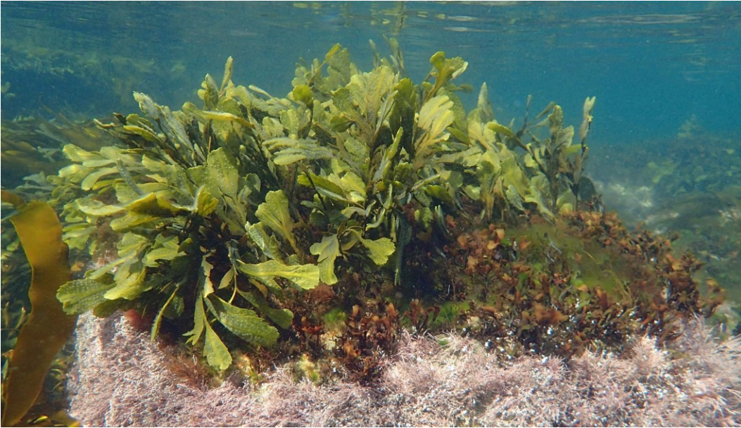
Naturtypen stenrev der findes i området.