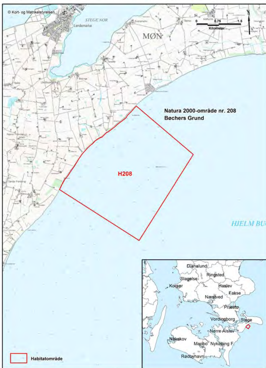
Bilag 1. Kort over Natura 2000-områdets placering og afgrænsning