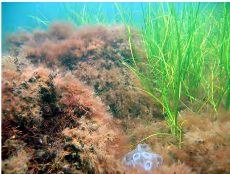
Parti med begroning af alger og blåmuslinger på store sten samt ålegræs.

Der er ikke modstridende naturinteresser i området for så vidt angår områdets udpegningsgrundlag.