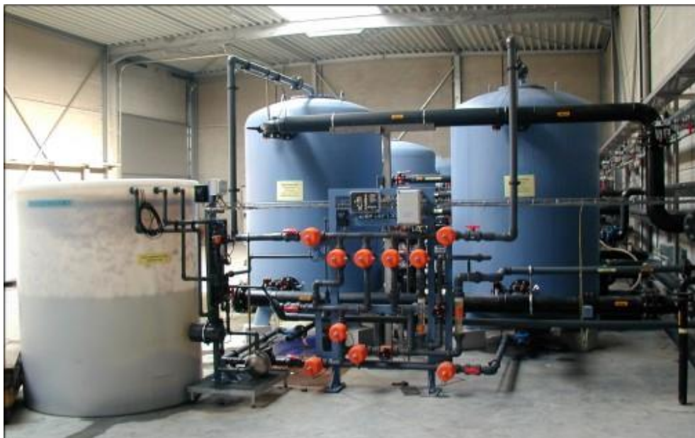
Ionbytningsanlæg fra Silhorko-Eurowater

Omkostningerne ved etablering af et ionbytningsanlæg er betydelige og sandsynligvis højere end en løsning, hvor efterpoleringen baseres på kontaktfiltrering.