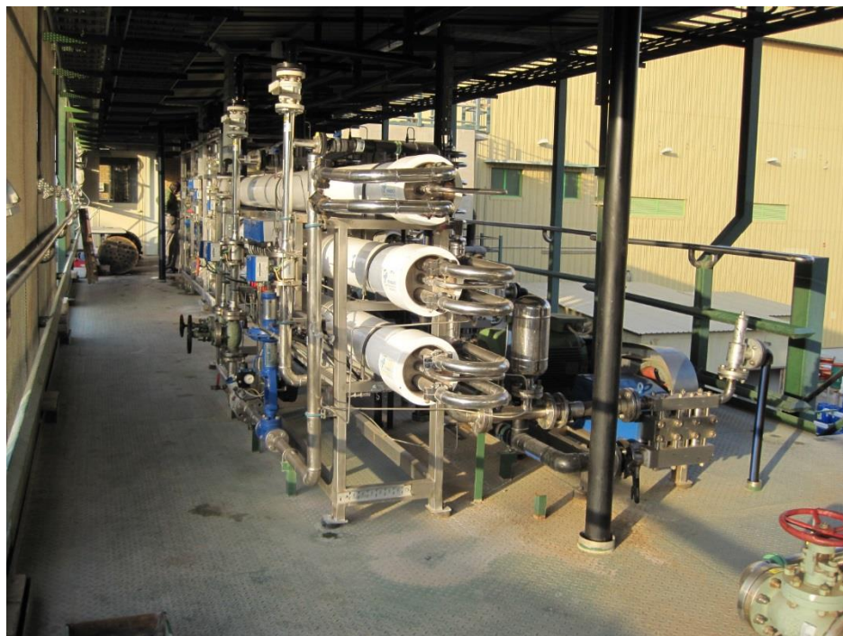
Nano-filtreringsanlæg på et danskbygget mejeri i Kuwait.