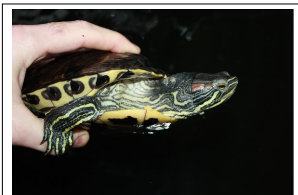
Røddøret terrapin

Beskrivelse: Ferskvandsskildpadden er kendetegnet ved en bred rød plet bag hvert øje. Den fuldvoksne skildpaddes skjold er typisk mellem 20-30 cm. langt og de kan veje op til 2 kg 1 . Hunnerne er større end hannerne, der til gengæld har længere og tyndere haler 2 . Skjold og hud er grøn til brunlig med gule pletter/striber. Ungernes skjold er lysegrønt og blødt, men efterhånden som de bliver ældre bliver skjoldet mørkere og ofte også begroet med alger. Tærne har skarpe kløer og svømmehud.