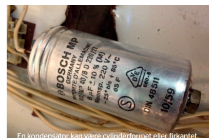
En kondensator kan være cylinderformet eller firkantet.

PCB står for Poly-Chlorede Biphenyler. PCB kan overføres til mennesker gennem kosten, ved indånding og ved hudkontakt. Fødevarer er den største kilde til PCB i kroppen for befolkningen som helhed. PCB anses ikke for at være akut giftigt, men hvis man udsættes for meget PCB i mange år, kan det give helbredsproblemer. PCB er af WHO klassificeret som kræftfremkaldende hos mennesker. PCB, som ophobes i kroppen, kan blandt andet virke hormonforstyrrende, skade de indre organer, påvirke immun- og nervesystemet og øge risikoen for diabetes.