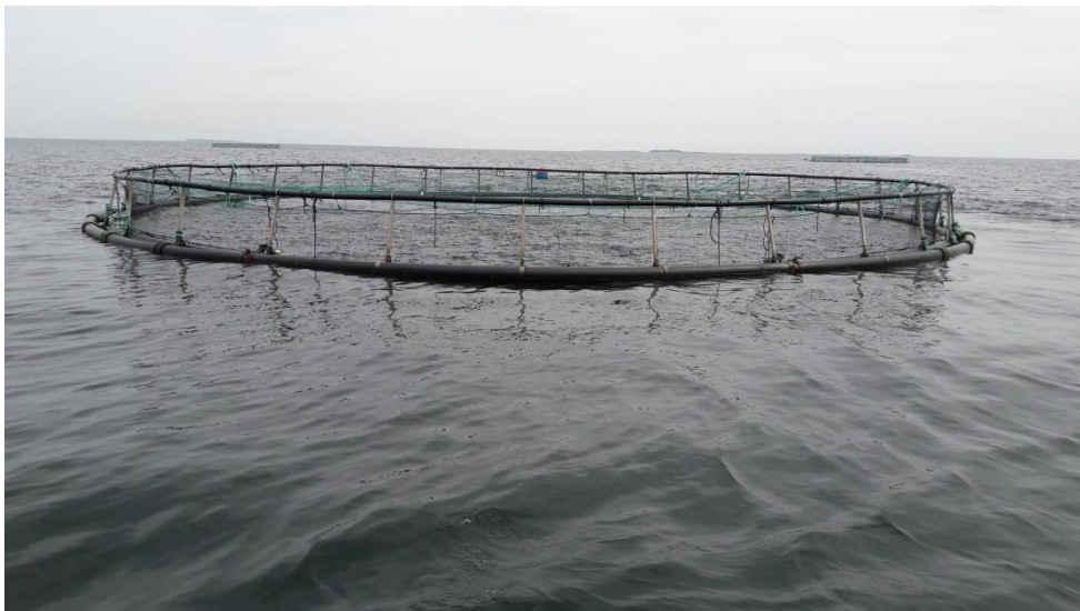
Figur 3. Nettene er fastgjort til en ankerblok på havbunden (single point), og buret kan derfor flytte sig ift. vandstrømmen.

Virksomheden har efter tilsynet oplyst, at nettene imprægneres ved neddykning i kobberholdigt imprægneringsmiddel (Flexgard Superior C) på virksomhedens egne faciliteter i Snaptun. Dyppekarret fyldes med 140 L flexgard (~208 kg), og der tyndes op med 140 liter vand. Indholdet af kobberoxid i Flexgard er 24 % baseret på vægt, og 208 kg svarer dermed til en samlet kobbermængde på 50 kg. Virksomheden oplyser desuden, at nettene, der anvendes på Nordby Bugt Havbrug, imprægneres én gang i løbet af en sæson. Hvis nettene stopper til pga. begroning i løbet af sæsonen, udskiftes de med ikke-behandlede net. Efter netskift sejles de behandlede net ind til landfaciliteterne i Snaptun, hvor de opbevares til rensning kan finde sted. Rensningen foregår ved manuel højtryksspuling, hvor nettene hænges op, og hvor det afrensede materiale opsamles i lukkede brøndenheder via afløb. Når rensningen er færdig, opsamles det kobberholdige materiale i palletanke og affaldet bortskaffes.