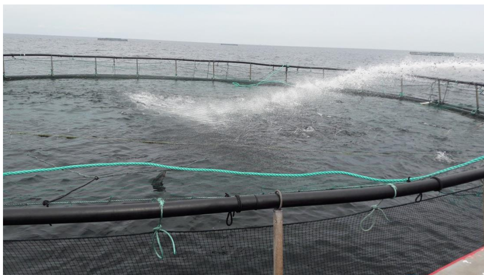
Figur 2. Foderet bliver distribueret med en foderkanon, der henter tørfoderet i lastrummet og fordeler med en vandstråle. Havbruget har tilladelse til at anvende op til 250 tons foder pr år.

Miljøstyrelsen modtog den 31. januar 2016 virksomhedens indberetning af egenkontrollodata fra Nordby Bugt Havbrug. Det oplyses for produktionsår 2016, at der i perioderne 5/9 – 9/9 og 22/9 – 26/9 2016 er anvendt medicinfoderet, Aquavet OA (oxolinsyre). Snaptun Fisk A/S har efterfølgende fremsendt en foderspecifikation på de anvendte fodertyper, Efico 939s og Aquavet OA, som blev anvendt i sæsonen 2016. Virksomheden oplyser, at kvælstofindholdet i det anvendte medicinfoder er lavere end angivet på årsopgørelsen, hvilket betyder, at udledningen af kvælstof fra havbruget er lidt lavere end indberettet. Snaptun Fisk Export A/S har efter tilsynet fremsendt et revideret indberetningskema for 2016.