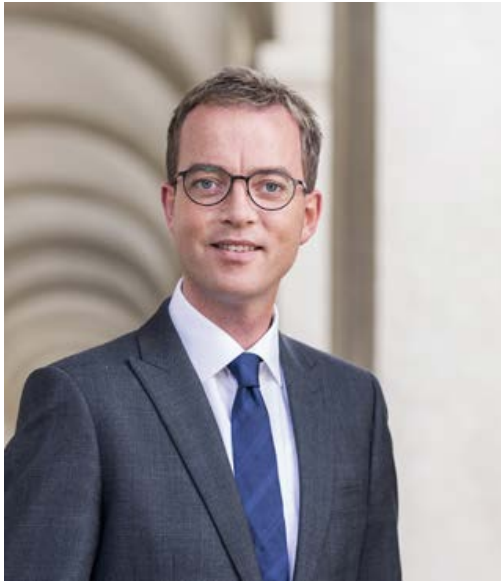
Miljø- og Fødevareminister Esben Lunde Larsen