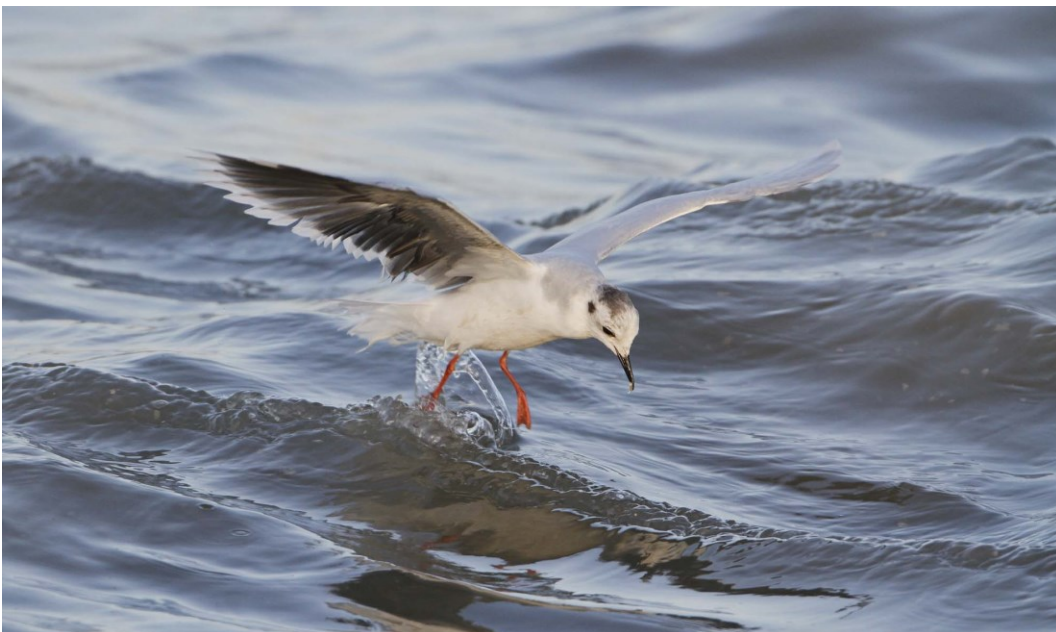
Dværgmåge i Nordsøen.

Dette Natura 2000-område er specielt udpeget for naturtypen arterne marsvin, gråsæl, spættet sæl, sortstrubet og rødstrubet lom samt dværgmåge. Natura 2000-planens målsætning og indsatsprogram er væsentlige elementer i beskyttelsen af denne og af en generel sikring og forbedring af områdets naturværdier.