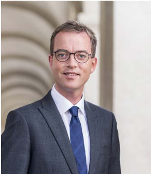
Miljø- og Fødevareminister Esben Lunde Larsen