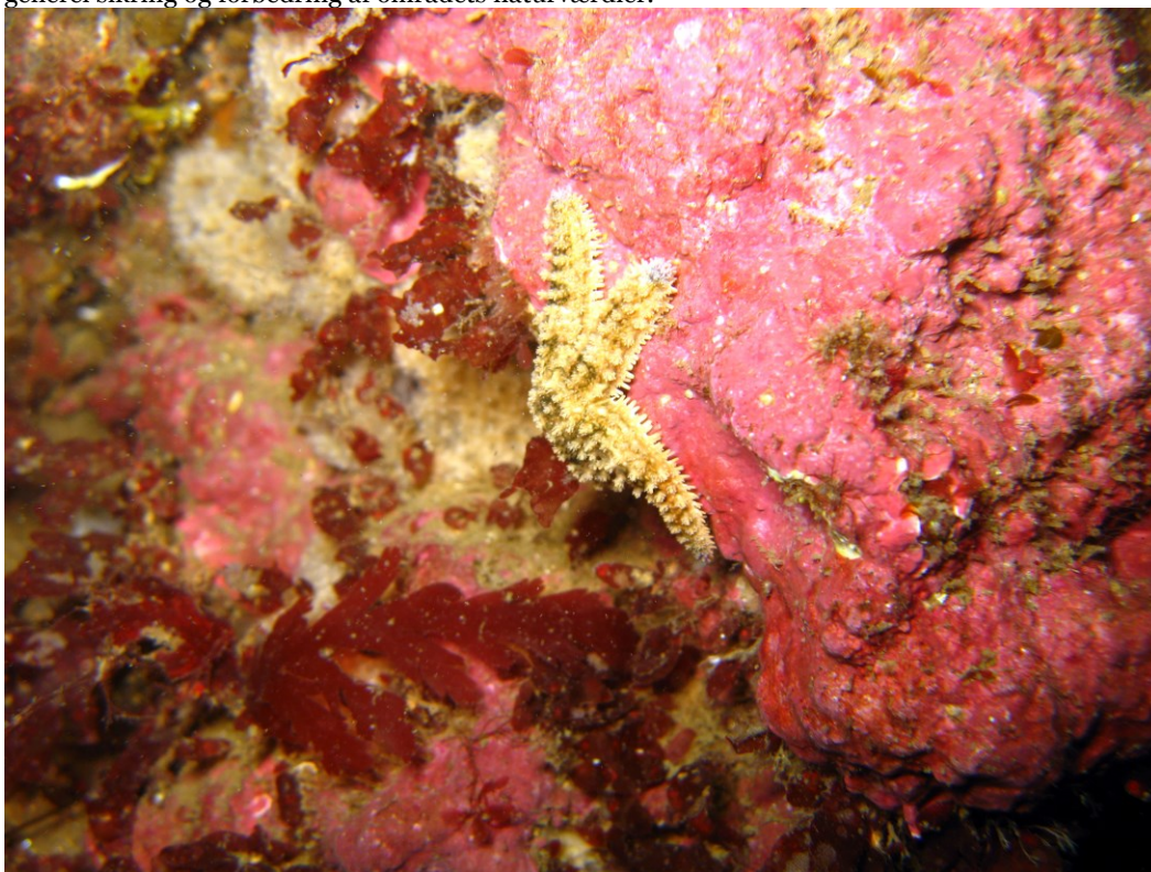
Røde kalkskorper og pigget søstjerne på rev i området.

Dette Natura 2000-område er specielt udpeget for naturtypen rev og boblerev. Natura 2000-planens målsætning og indsatsprogram er væsentlige elementer i beskyttelsen af denne og af en generel sikring og forbedring af områdets naturværdier.