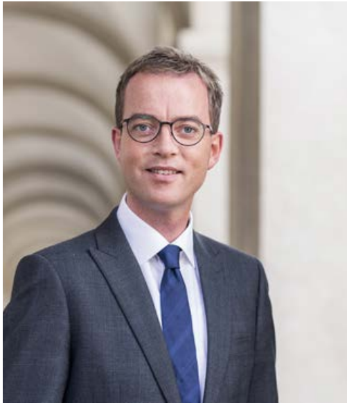
Miljø- og Fødevareminister Esben Lunde Larsen