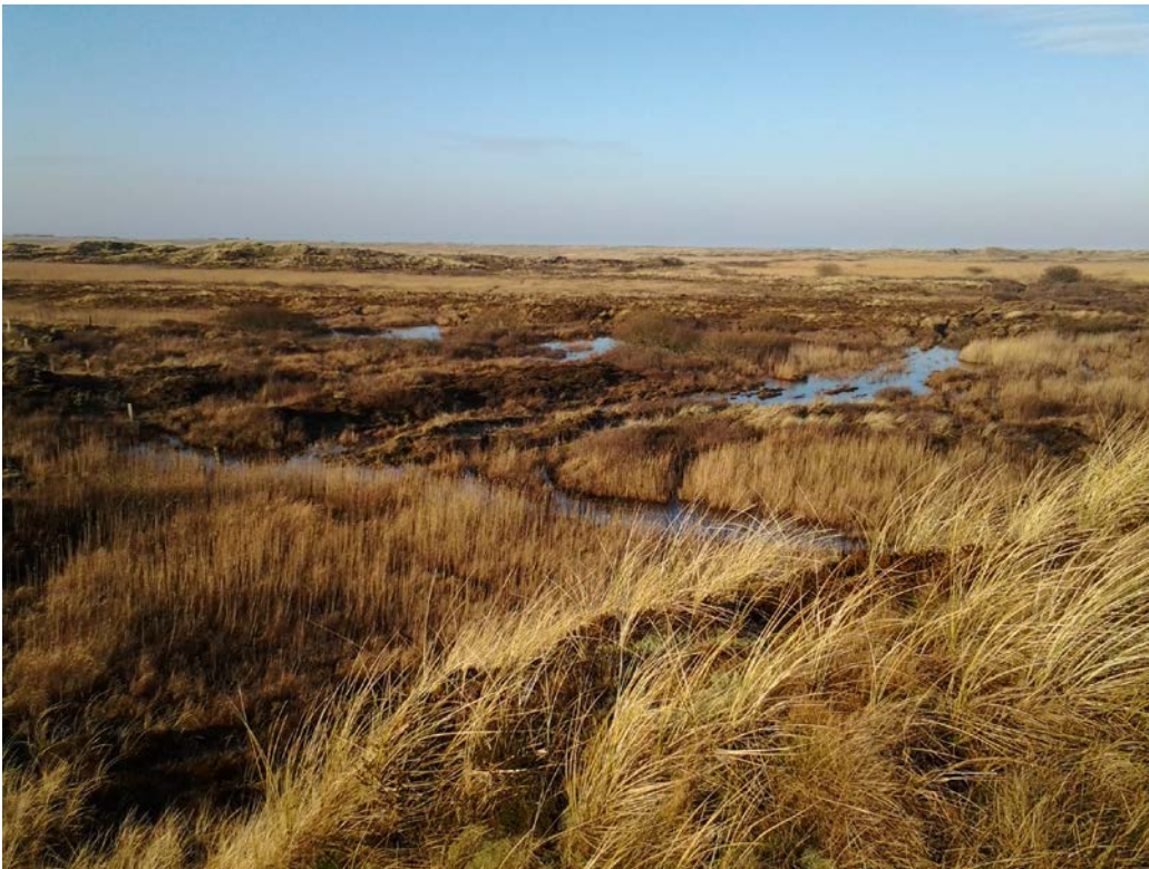
Udsigt over Rømø (Foto Naturstyrelsen).

Denne del af Natura 2000-området er specielt udpeget på grundlag af en væsentlig tilstedeværelse af en række yngle- og trækfugle, f.eks. ynglefuglene dværgterne, havterne, hvidbrystet præstekrave og klyde og trækfuglene mørkbuget knortegås og hjejle.