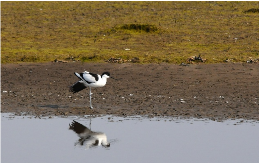
Klyde er på udpegningsgrundlaget.

Dette Natura 2000-område er udpeget på grundlag af følgende arter: Engsnarre, klyde, blåhals og hedehøg. Natura 2000-planens målsætninger og indsatsprogram er væsentlige elementer i beskyttelsen af disse og af en generel sikring og forbedring af området naturværdier.