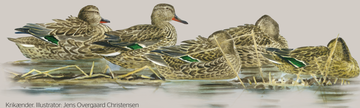
Krikænder.