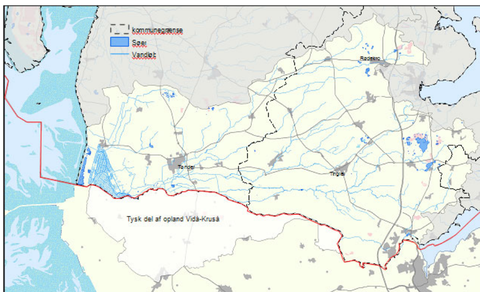
Figur 3.1. Hovedvandopland 4.1 Kruså/Vidå i det grænseoverskridende internationale vanddistrikt.

Vandoplandene på den tyske side er behandlet i sammenhæng med den tyske miljøvurdering af de tyske vandplaner for Eider og Schlei/Trave der kan ses på www.wasser.sh