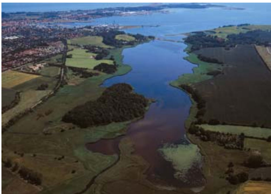
Holckenhavn Fjord.

Dette dokument udgør miljøvurderingen af vandplanen for Hovedvandområde 1.14 Storebælt.