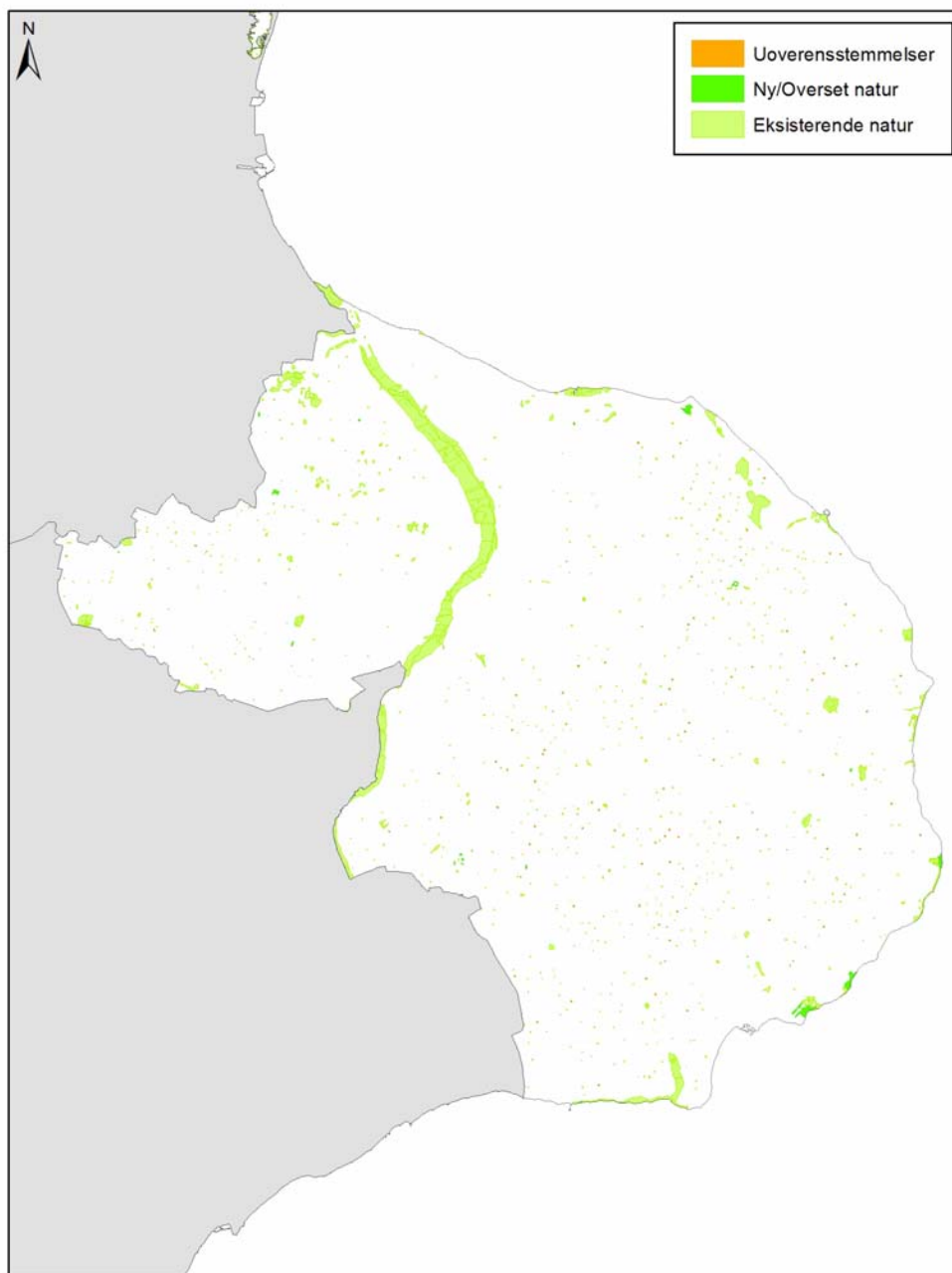
FIGUR 1 Kommunekort med særskilte signaturer for områder med ny natur, eksisterende natur og uoverensstemmelser.

Da Naturstyrelsens registrering i kommunen blev afsluttet i 2013 var der konstateret 1.048 § 3-områder. De udgør tilsammen et areal på 710,5 ha, hvilket udgør 2,8 % af kommunens areal. Bemærk, at det samlede antal og areal efter Naturstyrelsens projekt også omfatter de registrerede uoverensstemmelser.