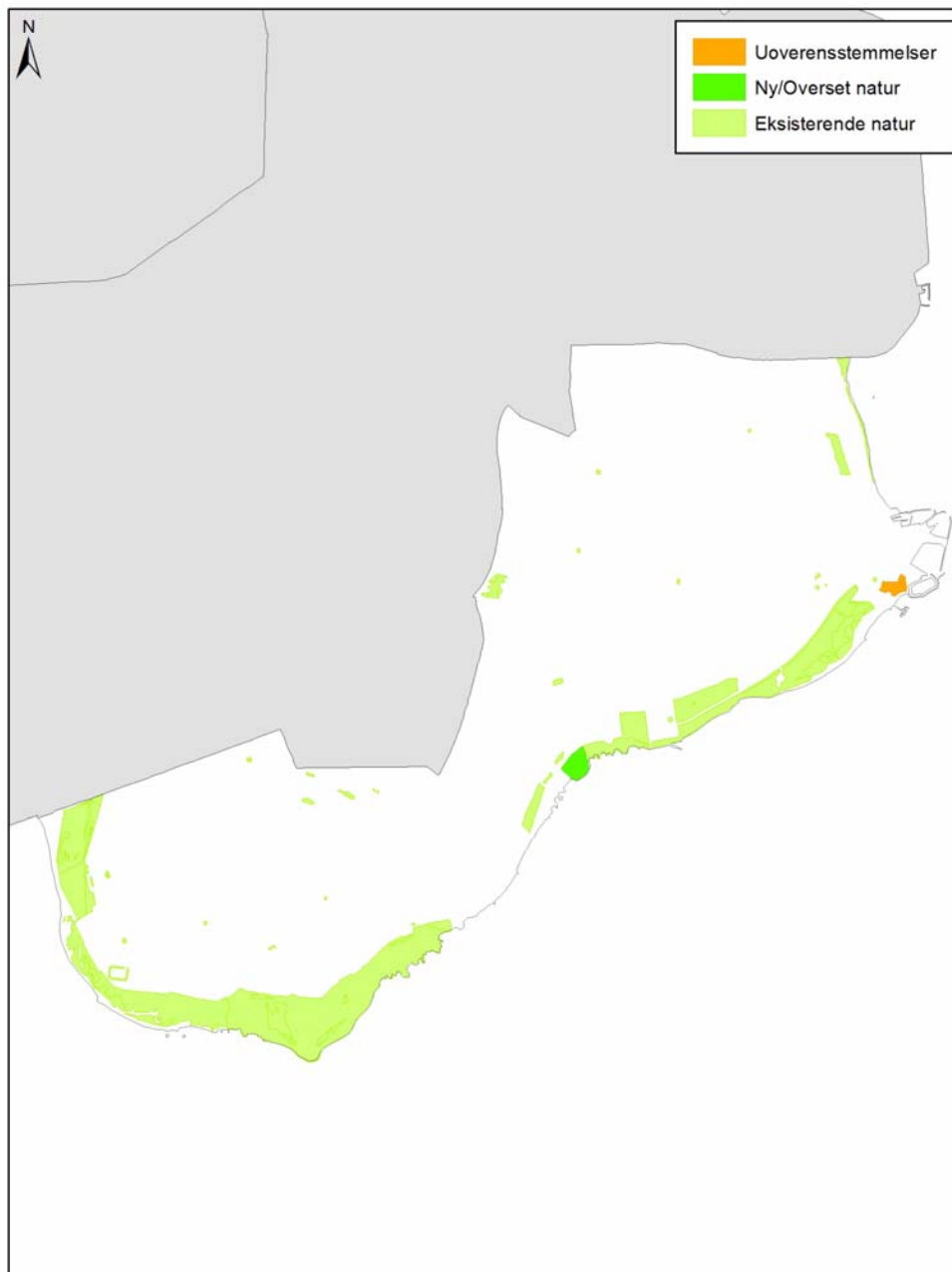
FIGUR 1 Kommunekort med særskilte signaturer for områder med ny natur, eksisterende natur og uoverensstemmelser.

Da Naturstyrelsens registrering i kommunen blev afsluttet i 2013 var der konstateret 87 § 3-områder. De udgør tilsammen et areal på 200,4 ha, hvilket udgør 10,9 % af kommunens areal. Bemærk, at det samlede antal og areal efter Naturstyrelsens projekt også omfatter de registrerede uoverensstemmelser.