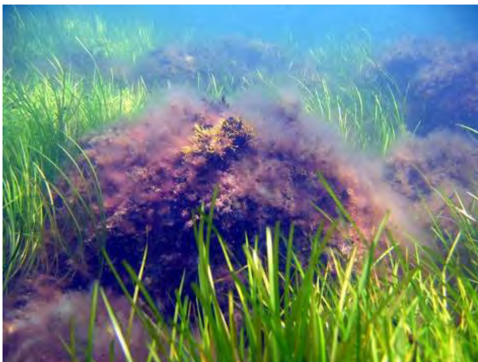
Rev med spredte store sten og områder med ålegræs.