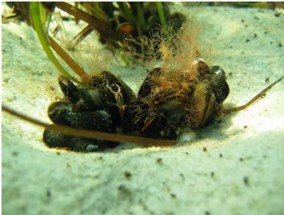
Filtrerende blåmuslinger i en klump på sandbund.