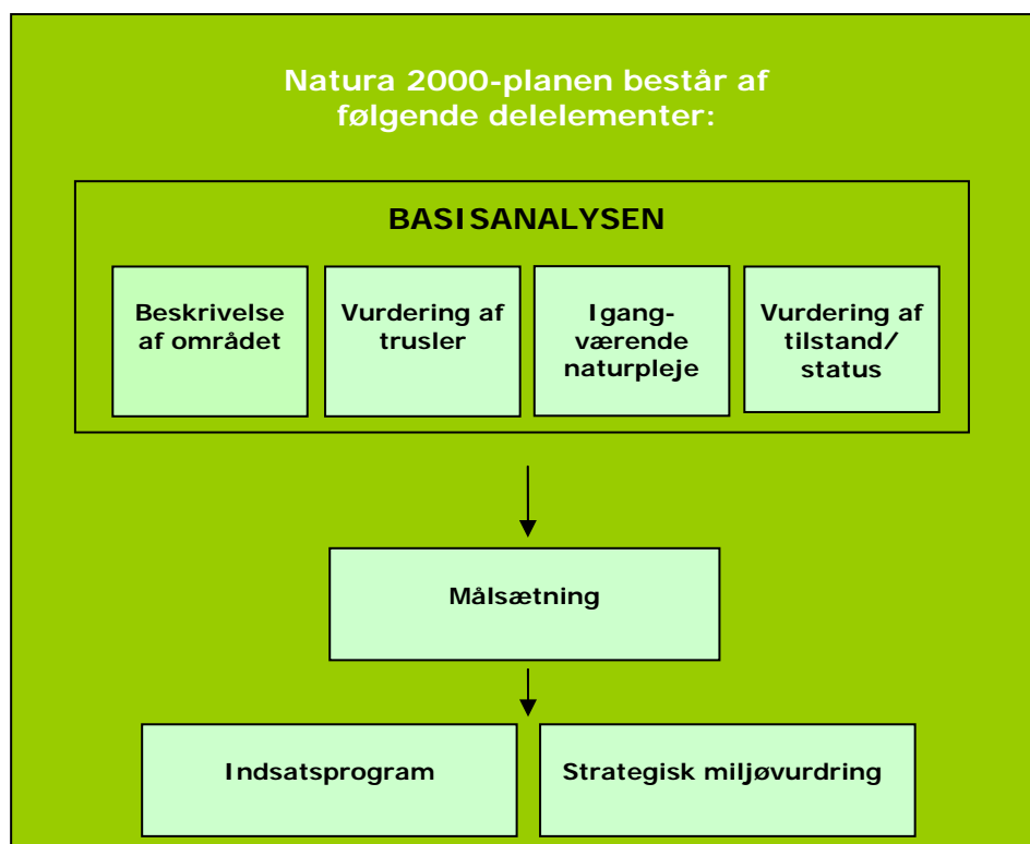
Figur 1. Opbygning af en Natura 2000-plan.

Planen omfatter "udpegningsgrundlaget", dvs. de naturtyper og arter, som området er udpeget for. Natura 2000-planens indhold er vist i figur 1.