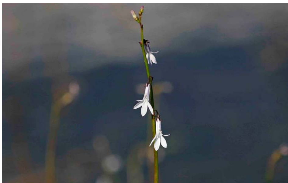
Tvepibet lobelie er karakteristisk for naturtypen lobeliesø og er afhængig af rent og klart vand.

I Skørsø området er der specielt fokus på naturtypen lobeliesø, der er levested for arter som gulgrøn brasenføde, sortgrøn brasenføde, strandbo og lobelie. Disse arter er afhængige af en god vandkvalitet i søen.