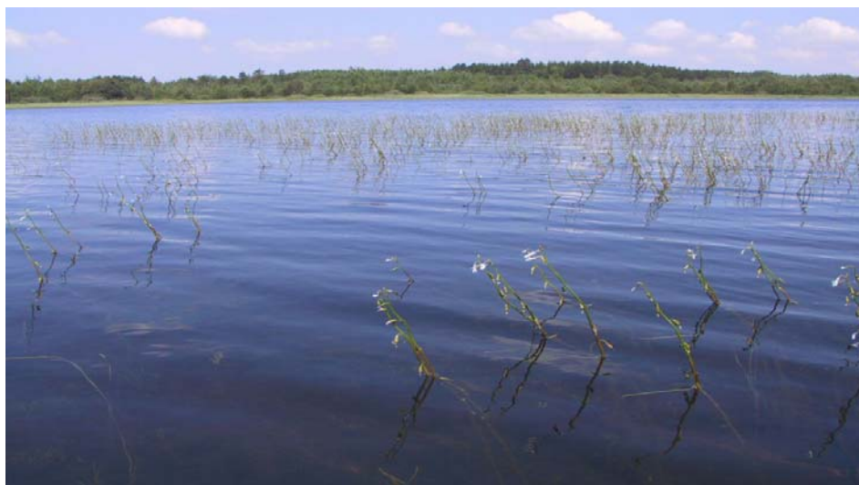
Udsigt over Skørsø, med tvepibet lobelie i forgrunden.

Inden for oplandet på ca. 60 ha., er der kun én bebyggelse og ingen større forureningskilder. Størstedelen (93 %) af oplandet er skov og naturarealer og kun 7 % er kategoriseret som landbrugsareal.