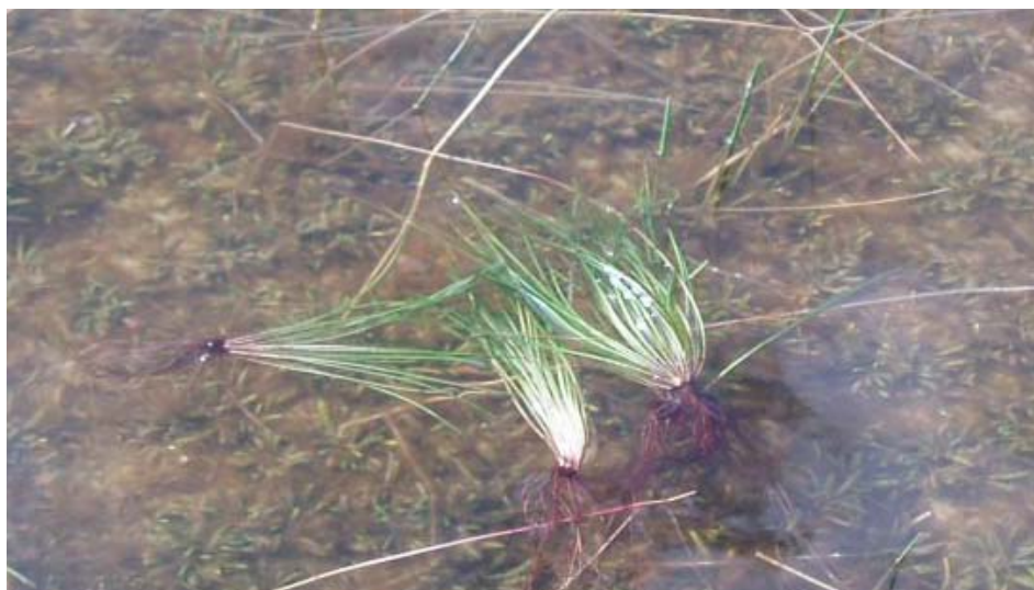
Sortgrøn brasenføde er en lille rosetplante som vokser på søbunden. I baggrunden ses strandbo og tvepibet lobelie. Disse grundskudsplanter er karakteristiske for rene næringsfattige søer – lobeliesøer.