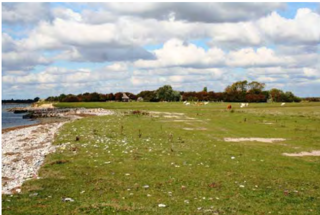
Enø, strandoverdrev og strandeng.

Da naturhandleplanen ikke sætter nye rammer for fremtidige anlægstilladelser eller yderligere vil kunne påvirke internationalt udpegede naturbeskyttelsesområder væsentligt, er planen ikke omfattet af lov om miljøvurdering af planer og programmer.