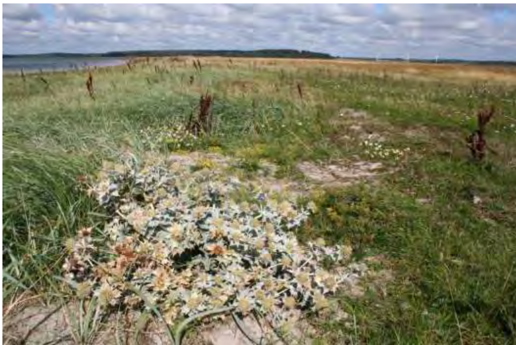
Strand-mandstro på Dybsø.

Du kan i dette link, se hvordan man forestiller sig at planerne kommer til at virke. Se http://www.naturstyrelsen.dk/Naturbeskyttelse/Natura2000/Natura_2000_planer/Baggrund/Saadan_virker_planerne/