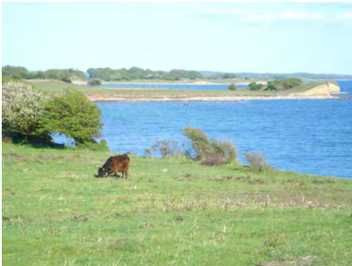
Knudshoved Odde, gennem græsning kan naturtyperne strandeng og overdrev bevares.