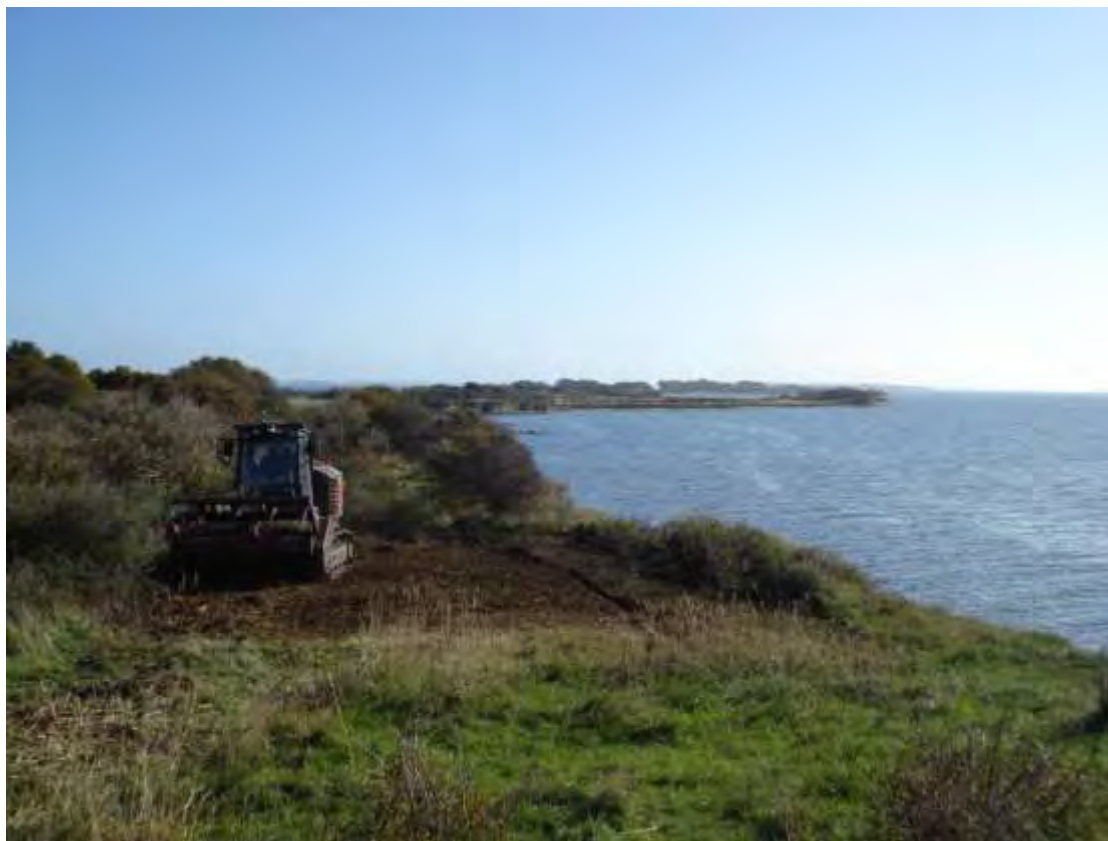
Knudshoved Odde, rydning af krat kan være nødvendig for at bevare overdrev.