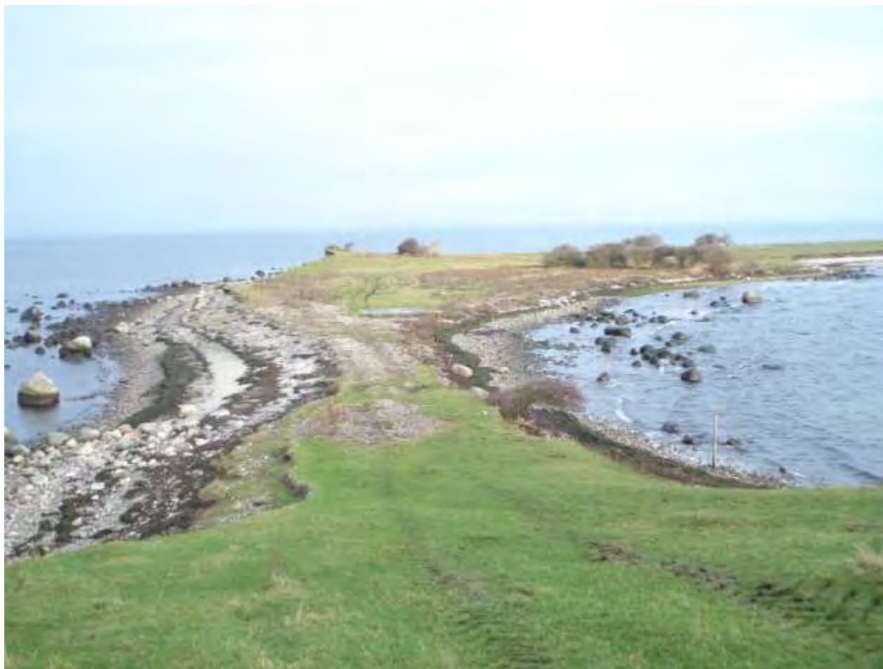
Knudshoved Odde, fredet, dobbeltkyst med oprindelig bestand af Klokkefrø.

For de marine naturtyper reguleres tilførslen af næringsstoffer og miljøfarlige stoffer via vandplanen.