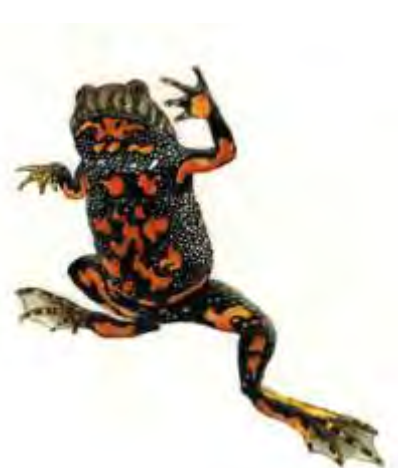
Enø, klokkefrøvandhul og klokkefrø Tegning Kåre Fog