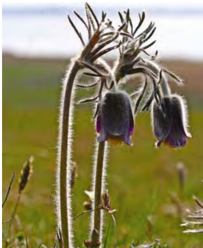
Nikkende kobjælde på Stejlebanke.