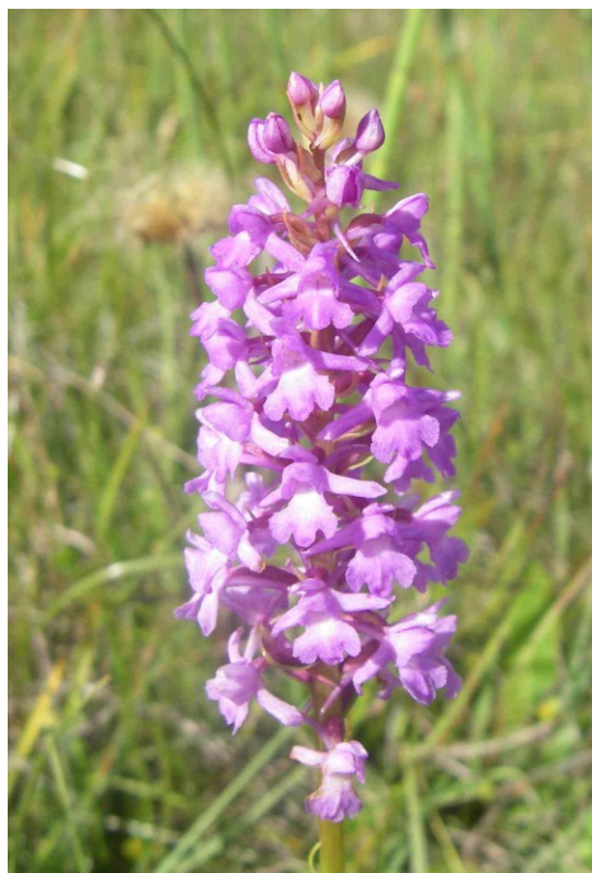
Figur 1: Tæt blomstret trådspore, Foto: Steffen Sørensen

Af andre fine terrestriske lokaliteter i området kan nævnes skrænterne på Nekselø samt Eskebjerg Vesterlyng, som er et enestående værdifuldt klitlandskab, der bl.a. huser et