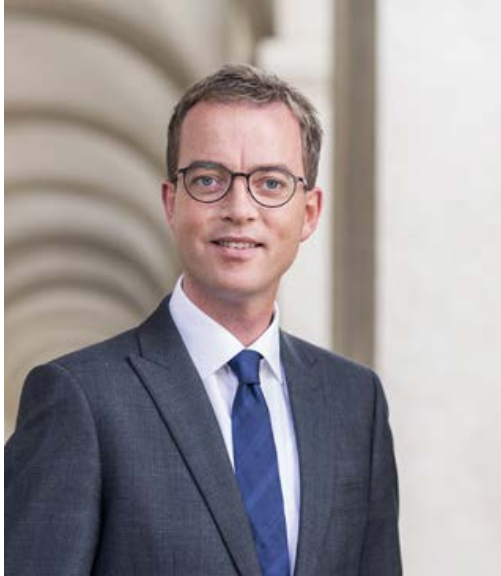
Miljø- og Fødevareminister Esben Lunde Larsen