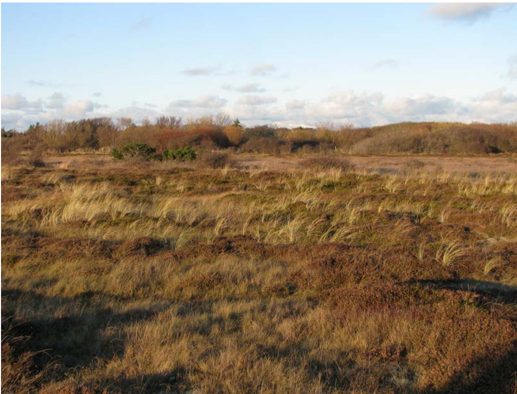
I forgrunden ses åben klithede og i baggrunden klitlavninger i fri succession.

Dette Natura 2000-område er specielt udpeget på grundlag af en væsentlig tilstedeværelse af klitnaturtyperne: klithede, klitlavning og grå/grøn klit. Endvidere er Marsvin på udpegningsområdet for dette Natura-2000 område. Natura 2000-planens målsætninger og indsatsprogram er væsentlige elementer i beskyttelsen af disse og af en generel sikring og forbedring af området naturværdier.