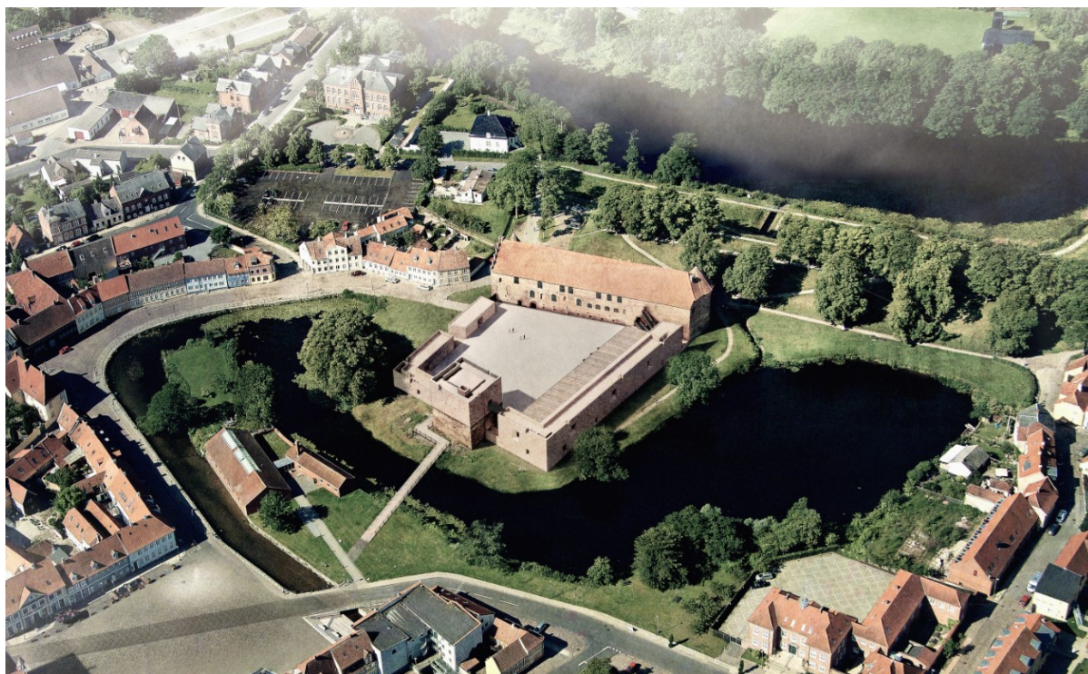
Figur 2-1 Skitse af det planlagte projekt, set fra nordøst. Man ser den nye adgangsbro, det forhøjede vagttårn, nordfløjen der anvendes til udstillinger og den genopbyggede ringmur til venstre for vagttårnet. Bagerst ses den oprindelige Kongefløj, der er adskilt fra de nye bygninger. (Visualisering fra projektforslaget. Jaja Architects)