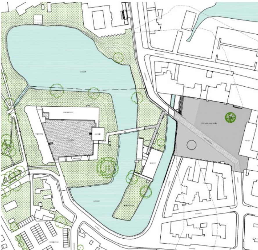
Figur 2-4 Situationsplan for Slotsholmen. (fra projektforslaget. Jaja Architects)