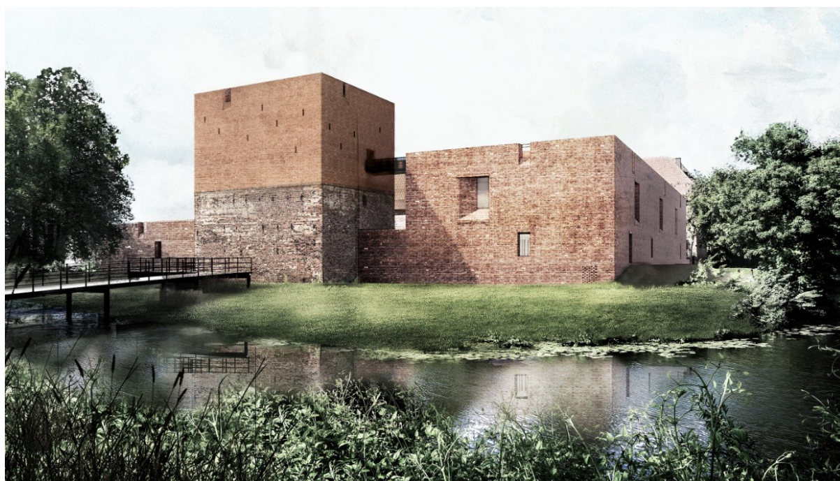
Figur 2-2 Skitse af den nye indgang med broen over voldgraven og det forhøjede vagttårn. I højre side udstillingsfløjen. (Visualisering fra projektforslaget. Jaja Architects)