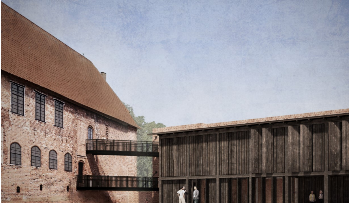
Figur 2-3 Parti fra slotsgården. Man ser Kongefløjen til venstre og den planlagte udstillingsfløj til højre. (Visualisering fra projektforslaget. Jaja Architects)