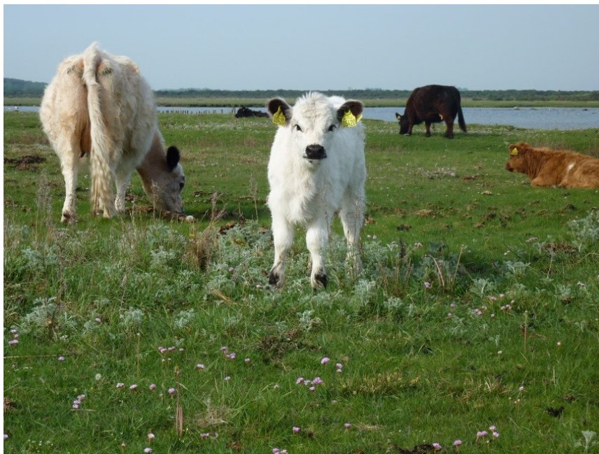
Helårsgræsning med Galloway på Eskebjerg Vesterlyng

De robuste kvægracer, der anvendes til helårsgræsning i Danmark, stammer næsten alle fra De Britiske Øer. Det er små til mellemstore racer, der har lidt forskellig tolerance overfor hhv. koldt, vådt og varmt vejr og som generelt foretrækker at være udendørs året rundt. De har gode moderegenskaber, kælver nemt og er generelt tolerante overfor bidende insekter.