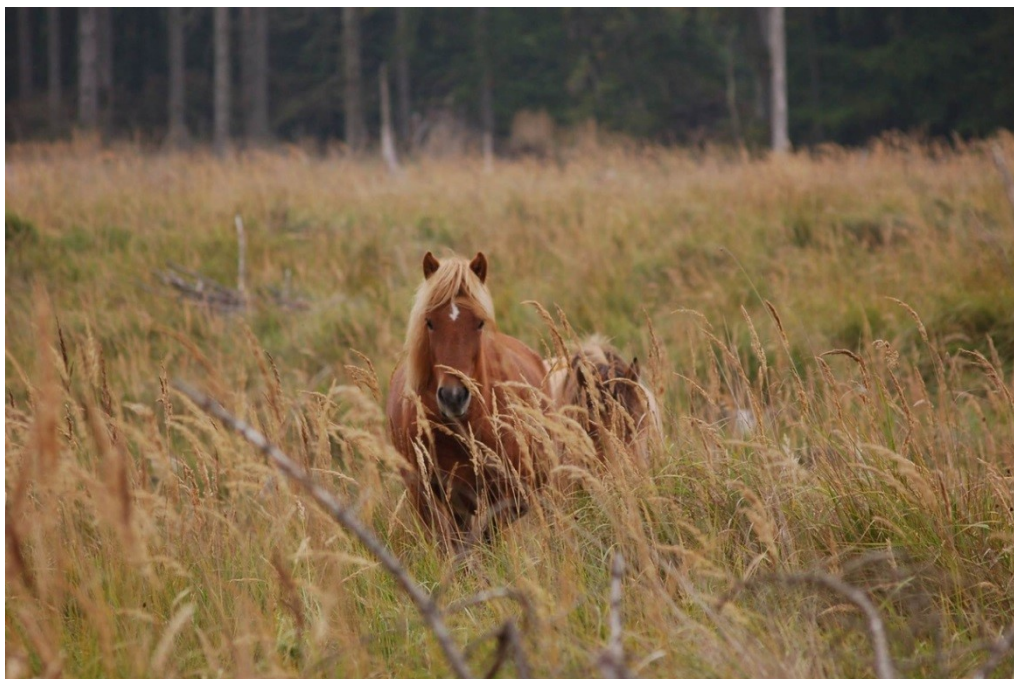
Tabel 3. Oversigt over hårdføre hesteracer, der er egnede til helårsgræsning