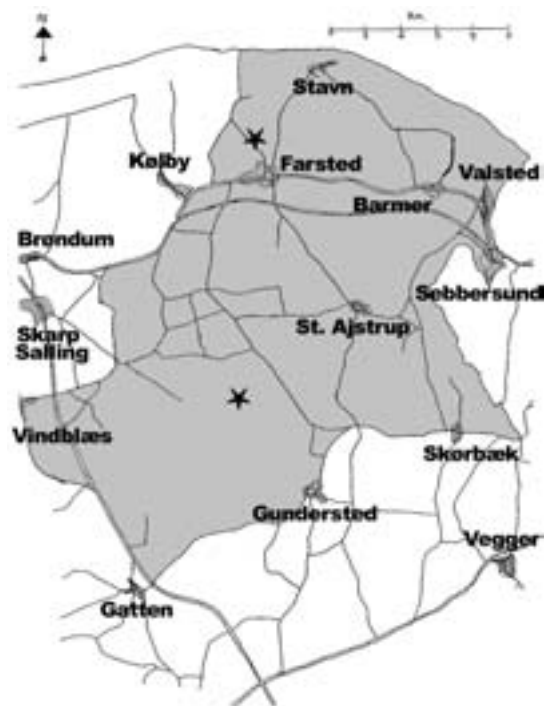
Kort 6. Målområde for Vesthimmerland