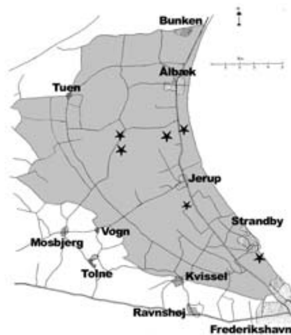
Kort 8. Målområde for Vendsyssel

Det vil være rimeligt at forvente, at der kan etableres 6 til 7 nye metapopulationer indenfor målområdet.